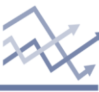
Chart of the day